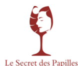
Le Secret des Papilles

Plus qu'un cours d'œnologie, Le Secret des Papilles, c'est une professionnelle diplômée, retraçant pour vous l'histoire du terroir, des cépages et tous les aspects techniques des délices viticoles. À ses côtés, vous dégusterez les secrets de la vigne et du vin, de -7000 à nos jours, puis découvrirez les caractéristiques du vignoble français et en particulier des vins de Loire. Un atelier d'œnologie unique dans le Val de Loire. La partie technique se déroule au cœur du monde de la vigne et du vin et la partie pratique, au sein de notre salle de dégustation. En demi-journée ou journée complète, en privé ou en groupe.